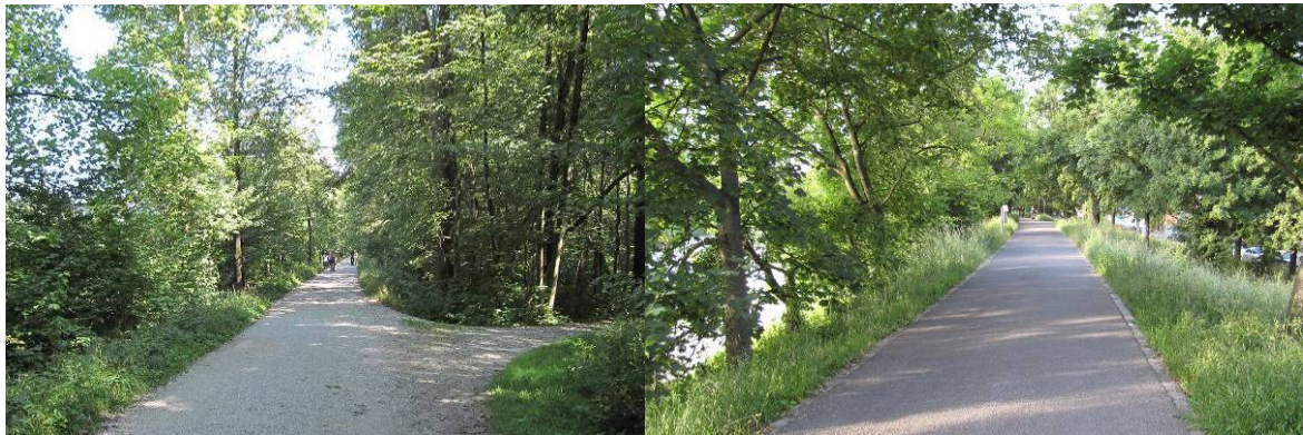
Abbildung 4: Die Gestaltung von Deichen im innerstädtischen Bereich von Thalkirchen in München (links) und Bad Cannstatt in Stuttgart (rechts) im Jahr 2009

Neben den technischen und naturschutzfachlichen Aspekten treten jedoch nicht selten andere Nutzungen in den Vordergrund, die mit den zwei genannten (Haupt)Aspekten weniger zu tun haben, sondern den anthropogenen Drang repräsentieren, den Deich für sich zu nutzen. Hierbei werden Aspekte der Landschaftsgestaltung bzw. des Stadtbildes ebenso berührt wie Aspekte der Naherholung und der Nutzung der Fläche oder des Gewässers durch die Forst-, Fischerei- oder Agrarwirtschaft. In intensiv frequentierten Stadtbereichen kann die Naherholung und das Stadtbild maßgebend werden. Dies kann zu technisch aufwendigen Deichen führen, die jedoch zugleich ein hohes Maß an Freizeitgestaltung ermöglichen (Abbildung 4).