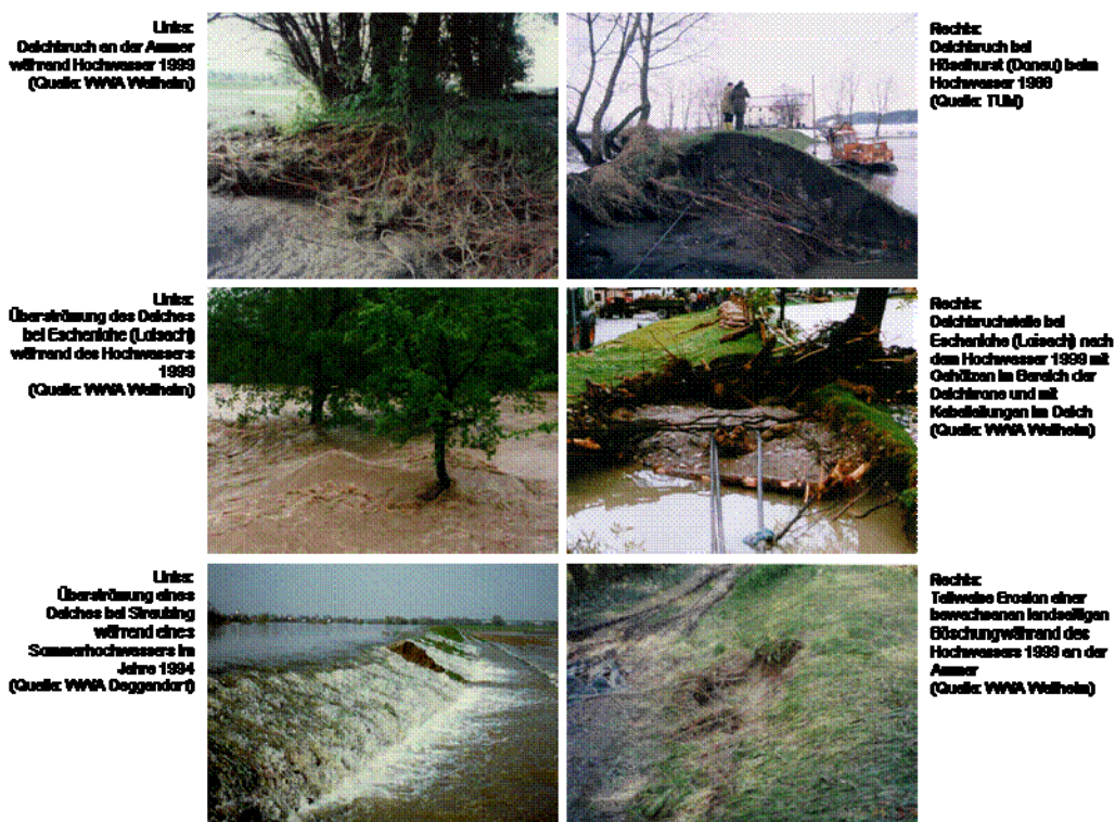
Abbildung 2: Auswahl an möglichen Schäden an Deichen im Hinblick auf unterschiedliche Bewuchsformen (aus Haselsteiner & Strobl, 2005 )